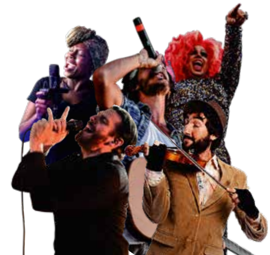
メンバーの配置参考