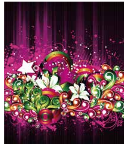
使用予定 背景、イラスト