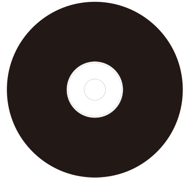
入稿データの背面に 白場用の版データをご用意下さい。