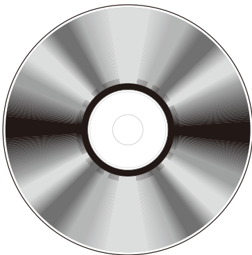
使用メディア:銀盤