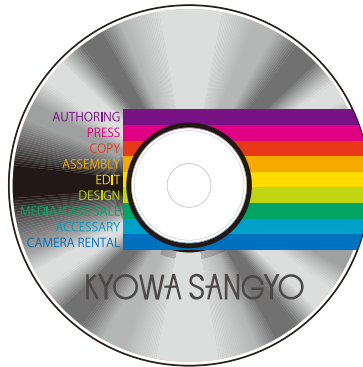
完成イメージ (絵柄のみ白地を入れる)