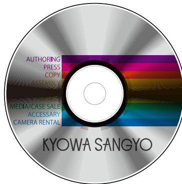
完成イメージ (後ろの銀盤が透けて見える)