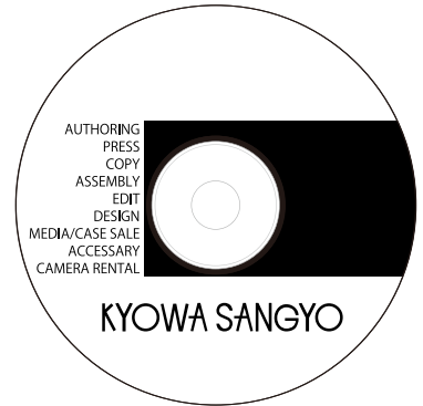
絵柄部分に白場用の 版データをご用意下さい。