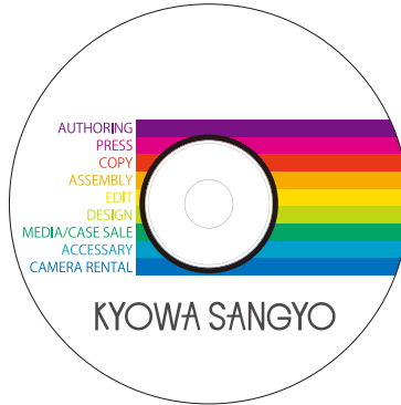
完成イメージ (全面白)